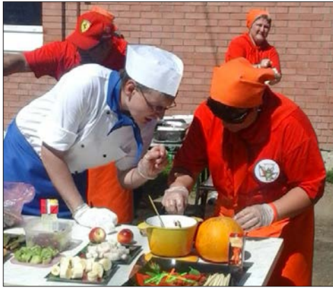
Несомненно, одним из запоминающихся событий лета для заводчан стал конкурс «Кулинарный поединок».

Чтить корпоративные традиции – одна из самых добрых черт коллектива АВТОВАЗа. Есть среди них многолетние традиции, а есть и совсем молодые, как проводимый компанией «КорпусГрупп» кулинарный поединок.