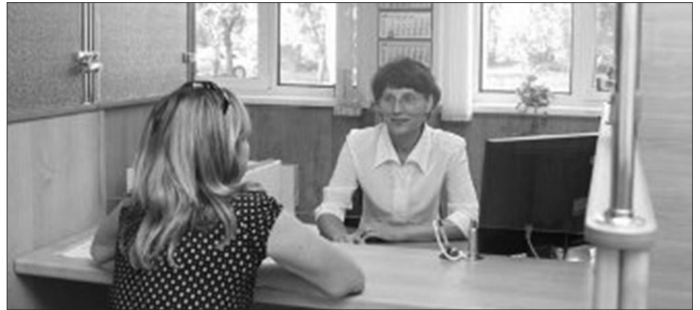
В центральном офисе АО «НПФ АВТОВАЗ»

До конца 2015 года гражданам 1967 года рождения и моложе предоставлено право сделать свой выбор: сохранить право на накопительную пенсию или от нее отказаться. С 2016 года накопительная пенсия будет формироваться только