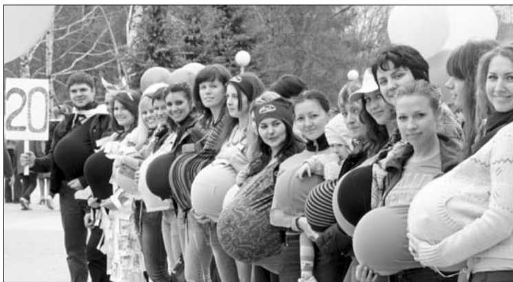
Ссылка на ютубе: http://www.youtube.com/watch?v=51R6D0tFM0

Этот пункт снова появился с 1 января 2011 года в коллективном договоре благодаря достигнутой договоренности профсоюзного комитета и администрации ОАО «АВТОВАЗ». И это, согласитесь, прекрасный повод для хорошего настроения будущих мамочек!