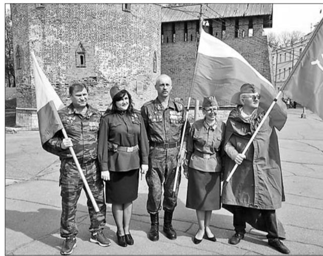
Встречи в Смоленске

В Минске участники марш-броска приняли участие в серии памятных мероприятий. Одно из них прошло у стелы «Минск – город-герой», где нам передали капсулу с минской землей. В свою очередь, мы передали ветеранам Минска точную копию самолета Ил-2, который производился в Куйбышеве в годы войны.