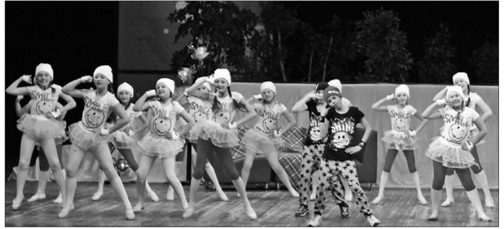
Народный ансамбль танца «Кредо»

А 1 июня с 15 до 18 часов будет работать открытая площадка у ДКИТ – город детей Д'КИТБУРГ.