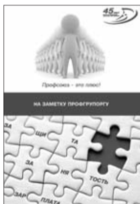
на заметку профгруппоргу

Одним из основных направлений профсоюзной деятельности является работа по заключению коллектив-