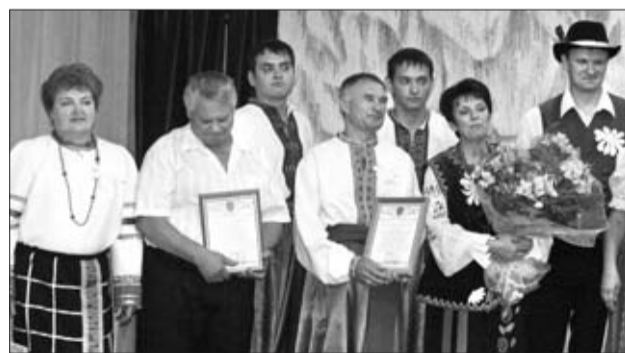
Народов много – семья одна