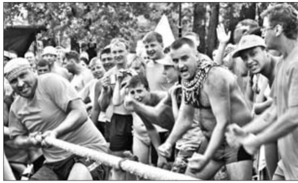
Турслет – добрая традиция МТП

Женсовет производства регулярно контролирует этот процесс, а в конце лета подводит итоги с награждением цехов-победителей. В 2001 году в этом конкурсе приняли участие 24 человека из 12 цехов и служб производства, в последующие годы