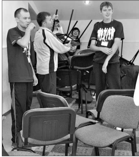
На тренинге уверенного поведения

«Талия» была итоговым заданием. Здесь понадобилось и умение договариваться, слушать и слышать... Решение, еще одно – и «талиа» команды из 60 человек составила всего несколько метров.