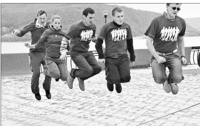
Одно из препятствий «веревочного курса»

Также порадовало, что на вопрос преподавателя, кто из присутствующих молодых профсоюзных лидеров считает себя неуверенным, лишь один человек поднял руку. Ну что ж, остается только гордиться, – подытожи-