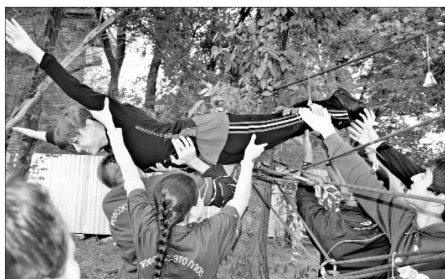
«Паутинка» – любимое испытание