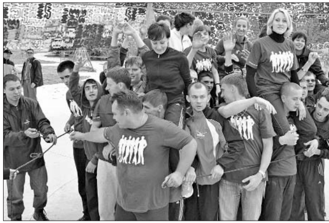
Вместе мы – сила!

здесь получили, поможет еще лучше организовать работу с молодыми. На таком форуме я в первый раз, для меня здесь очень много нового, все очень здорово, интересно, а самое главное – полезно.