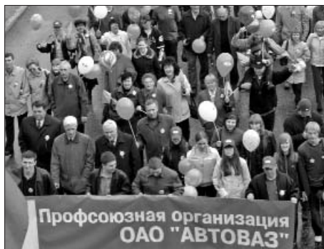
С нами во все времена АВТОВАЗ, Профсоюз и Весна!