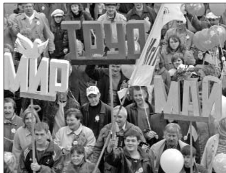
Я вступил в АСМ, Чтобы не было проблем!