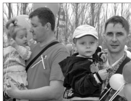
Защитит свои права Профсоюзная семья!