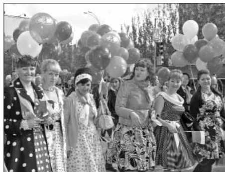
Смело и гордо заявим мы всем: Защита рабочих – профсоюз АСМ!