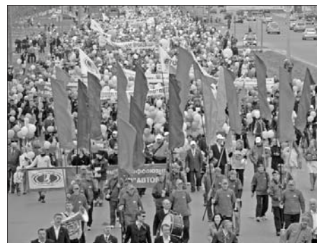
Сомкнув ряды, идет народ, Профсоюз, Молодежь, Автозавод!