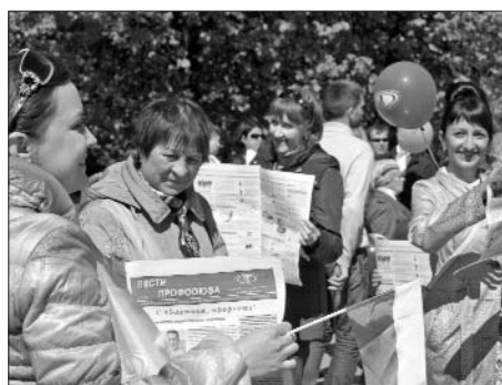
Молодежь и профсоюз – Очень прочен ваш союз!