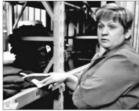
Проверка наличия СИЗ на складах МСП

Итоги проведенных проверок следующие: состояние комнат гигиены, гардеробов, мест общего пользования в основном удовлетворительное. Но все-таки проблемы есть: отсутствует горячая вода в женских туалетах и в душевых кабинках (ДпБ). Это не соответствует санитарным нормам. По данному вопросу направлено повторное ходатайство о строительстве душевой кабинки и подключении водонагревателя. В течение месяца комната гигиены женщин в корпусе 170/2 (СКП) находится в нерабочем состоянии, требуется ремонт труб. По данному факту направлен акт проверки в