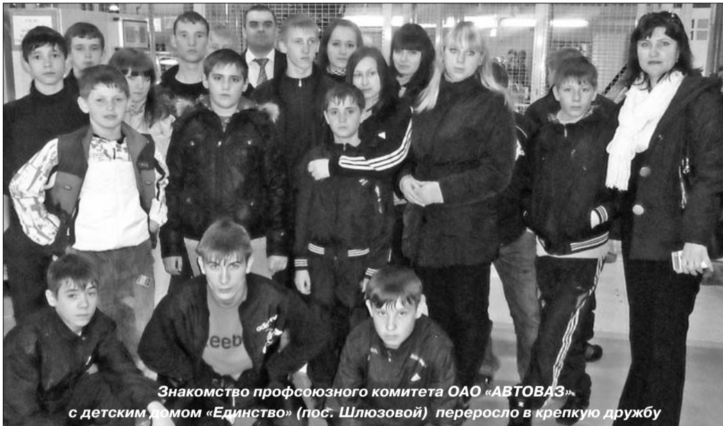
Знакомство профсоюзного комитета ОАО «АВТОВАЗ» с детским домом «Единство» (пос. Шлюзовой) переросло в крепкую дружбу

Знакомство профсоюзного комитета ОАО «АВТОВАЗ» с детским домом «Единство» (пос. Шлюзовой) произошло много лет назад и переросло в крепкую дружбу. С тех пор комиссия по социально-экономической и правовой защите женщин профкома ОАО «АВТОВАЗ» неоднократно проводила благотворительные акции по сбору денежных средств, вещей, книг для детишек. Все это проводилось и проводится для того, чтобы дать возможность ребятам почувствовать тепло большой и дружной семьи, воспитать в них веру в себя и в свои силы. 8 апреля представители комиссии снова посетили детский дом.