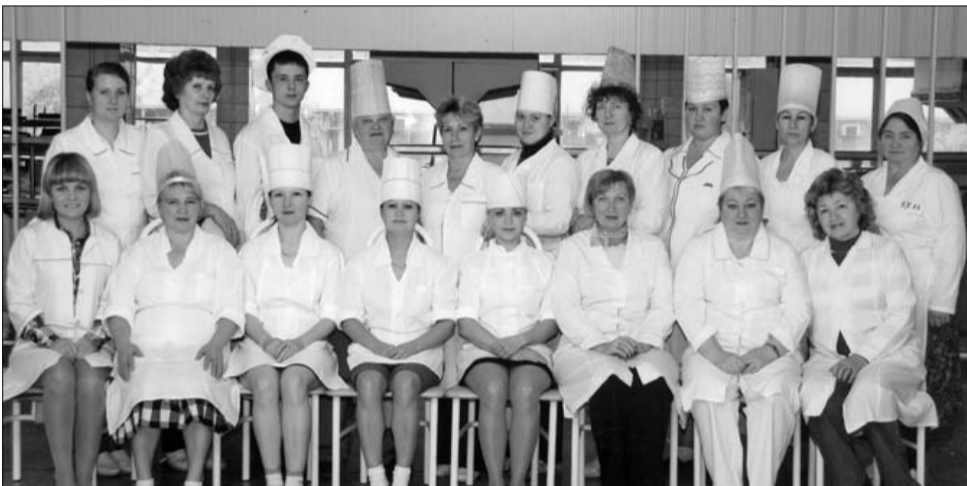
Дружный и сплоченный коллектив столовой № 28 объединения № 3

17 апреля 2011 года исполнилось 35 лет работы столовой № 28 объединения № 3. 33 года из которых она входила в КОП ОАО «АВТОВАЗ», а теперь – в состав КОРПУС ГРУПП ВОЛГА-ДОН.