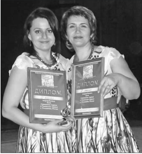
Наш дуэт проявил себя и профессионально, и творчески

Вместе с решением социально-трудовых и экономических проблем, традиционной сферой интересов и деятельности профсоюзов остается культурно-массовая работа. Одна из основных задач нашей комиссии –