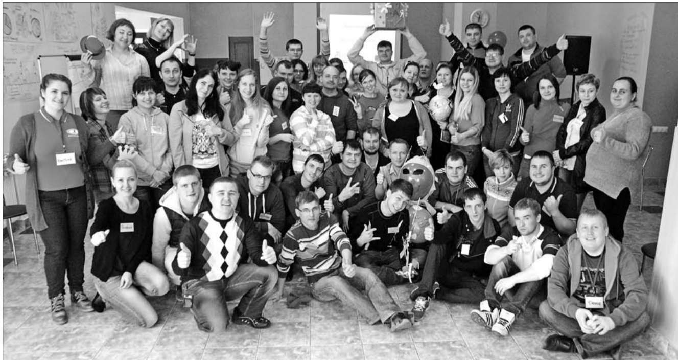
Участники семинара на УТБ «Раздолье»

• голосование по фотоконкурсу «1 Мая – твоя история»;