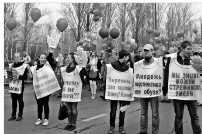
Первомай – 2014