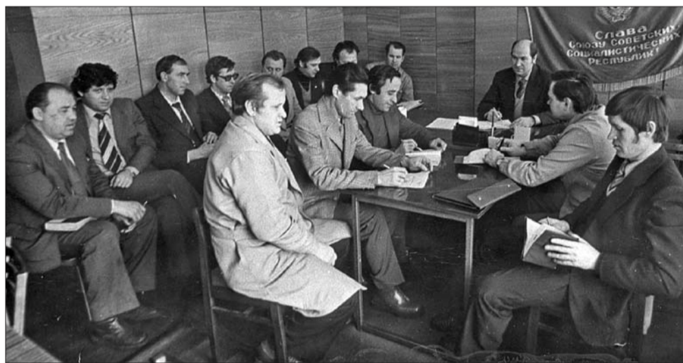
Фото из архива ОАиПРО: «А помнишь, как все начиналось?»

Для ремонтников не существует временных и творческих границ в решении поставленных целей. Специалисты ремонтной службы трудятся в праздники и выходные, в дневную и ночную смены. Все делается для того, чтобы обеспечить бесперебойный производственный процесс, устойчивую работу оборудования.