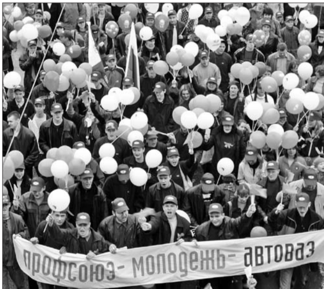
Первомай – 2004

– Но приближается Первомай-2015, и от вас вновь ждут свежего креатива. Что нового приготовил молодежный профсоюзный актив на предстоящий праздник в парке Победы?