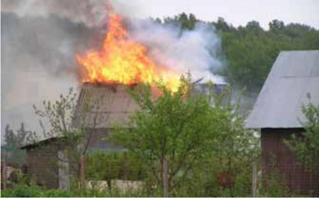
НАПОМИНАЕМ ОСНОВНЫЕ ПРИЧИНЫ ВОЗГОРАНИЙ.

Как известно, многие пожары, наносящие материальный урон, а порой и уносящие человеческие жизни, происходят из-за неосторожного обращения с огнем. Это касается и дачных построек – не все дачники соблюдают правила пожарной безопасности. Сегодня мы подготовили для вас информацию, как обезопасить свой участок от пожара и что делать в случае возгорания.