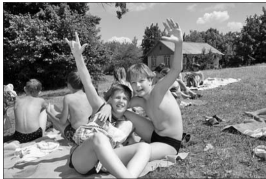
Свыше 34 тысяч человек оздоровились за 11 месяцев этого года

Наступил последний месяц уходящего года – декабрь. И уже не за горами время, когда будут подведены итоги работы за 2008 год по оздоровлению работников ОАО «АВТОВАЗ» и членов их семей. Однако, уже сейчас, рассматривая показатели, можно с уверенностью сказать, что обязательства, взятые на себя социальными партнерами: работодателем и первичной профсоюзной организацией ОАО «АВТОВАЗ» в области оздоровления работников общества будут выполнены.