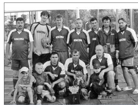
В здоровом теле – здоровый дух

В будни же основными вопросами в профсоюзной деятельности остаются вопросы по улучшению условий труда и