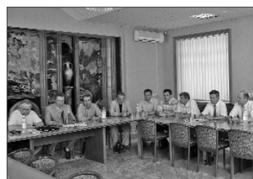
Здесь проходят «круглые столы» на особо актуальные темы