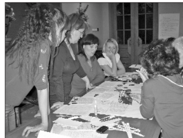
Профактивисты – постоянные участники семинаров