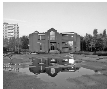
ЦОиПК – гордость профсоюза