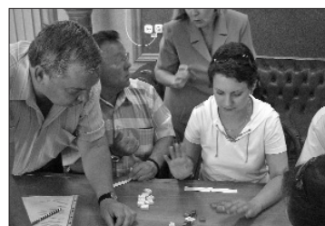
Занятия совсем не похожи на обычные лекции

8 июля исполняется 10 лет центру обучения и подготовки кадров профкома ОАО «АВТОВАЗ» (ЦОиПК). Сегодня профцентр – гордость первичной профсоюзной организации ОАО «АВТОВАЗ». Здесь проводятся курсы по всем направлениям профсоюзной работы. Программы составлены таким образом, что формируют универсальные знания, самостоятельное мышление и деятельность, развивают компетенцию профсоюзных работников, актива и рядовых членов профсоюза.