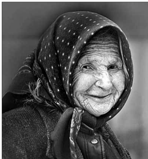
Многие люди работают после достижения пенсионного возраста не потому, что хотят работать, а потому, что иначе не проживешь.

В последнее время тема пенсионного возраста вновь стала одной из самых горячо обсуждаемых. Министерство финансов РФ начало новый виток в проработке общественного мнения по вопросу пенсионного возраста. Теперь инициатором этой идеи выступил сам глава финансового ведомства А.Л.Кудрин , декларируя на Санкт-Петербургском экономическом форуме в июне т.г. необходимость повышения в пятилетней перспективе пенсионного возраста для мужчин до 65 лет и до 60 лет для женщин. Основной аргумент – это необходимость финансовой стабилизации пенсионной системы и преодоление ее дефицита. На деле финансовое ведомство в очередной раз предлагает латать бюджетные дыры за счет работающего населения и пенсионеров.