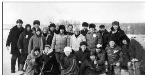
Первенство производства по подледному лову, 2005 г.