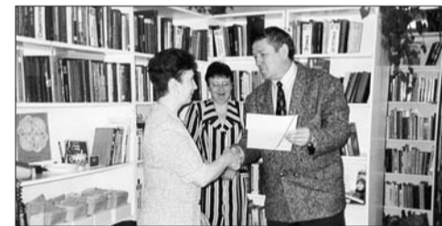
Профком и филиал библиотеки ПрП