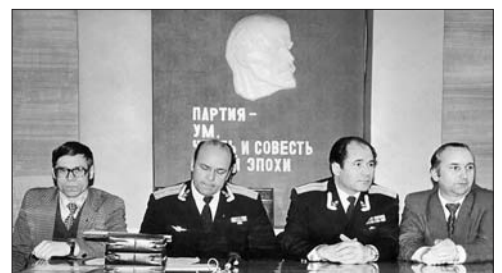
ПрП – шефы Северного флота и авиации