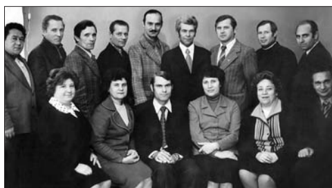
Профком прежних лет