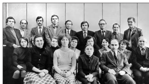
Профактив 80-х годов