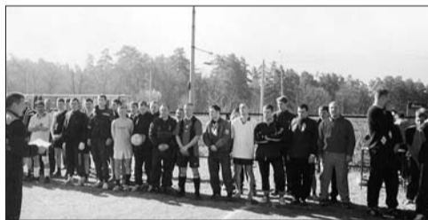
Первенство производства по футболу среди цеховых команд, 2004 г.