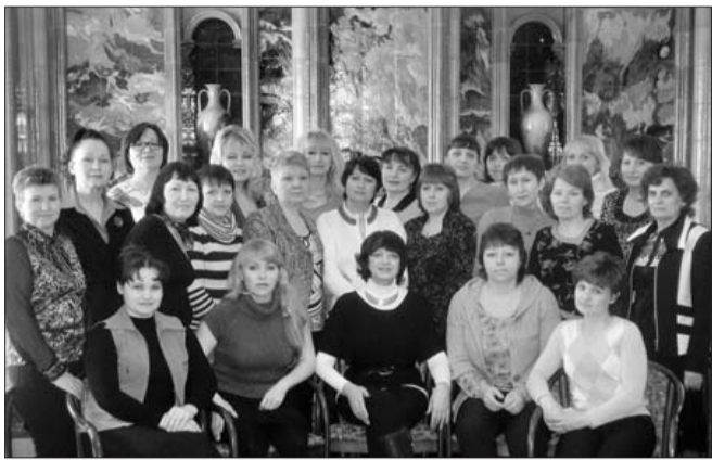
26 марта в центре обучения и подготовки кадров профсоюзного комитета ОАО «АВТОВАЗ» прошёл семинар для членов комиссии по социально-экономической и правовой защите женщин профкома СКП.

Совсем недавно завершилась отчётно-выборная кампания в нашей организации. Обновились составы профкомов подразделений и комиссий. Например, наша комиссия по