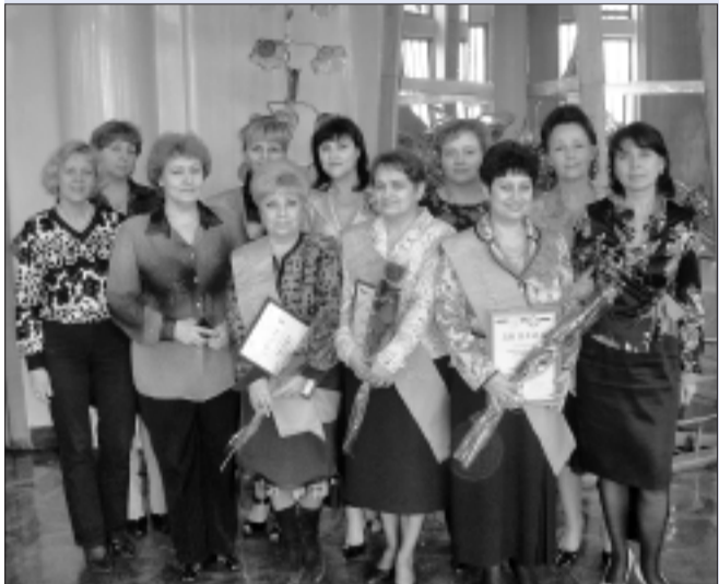
Хочу против традиции восстать И песнь сложить совсем земным богиням. О, человечество, дерзну я честь воздать Твоей воистину прекрасной половине...

По инициативе общественной организации «Союз женщин Самарской области» при поддержке Правительства и Федерации профсоюзов в областной Государственной филармонии прошел финал акции «Женщина Самарской области 2008 года».