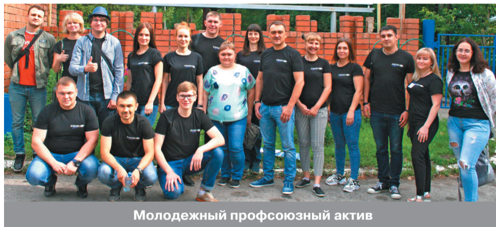
Молодежный профсоюзный актив

Работники, члены профсоюза АСМ, могут не посещать поликлинику, а передать уполномоченному по соцстрахованию своего подразделения (по согласованию с ним) следующую информацию: Ф.И.О., место отдыха, дата заезда. На основе данных уполномоченный формирует список и передает терапевту. После этого терапевт выпишет справки и передаст их уполномоченным, а те, в свою очередь – работникам.