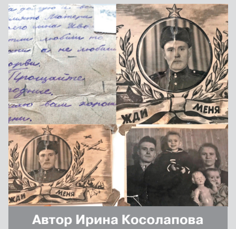
Автор Ирина Косолапова