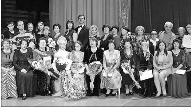
Артисты литературного театра

На пороге – весна, с ее приходом мир вокруг станет намного теплее и красочнее. Яркие, интересные, по-настоящему весенние события подготовил для тольяттинцев Дворец культуры, искусства и творчества.