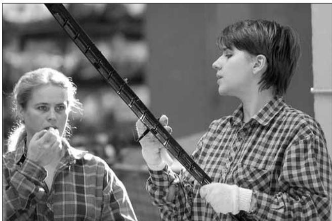
(Продолжение. Начало на 1 стр.)

В 2009 году Всемирный день охраны труда пройдет под девизом: «БЕЗОПАСНЫЙ ТРУД – ПРАВО КАЖДОГО ЧЕЛОВЕКА»