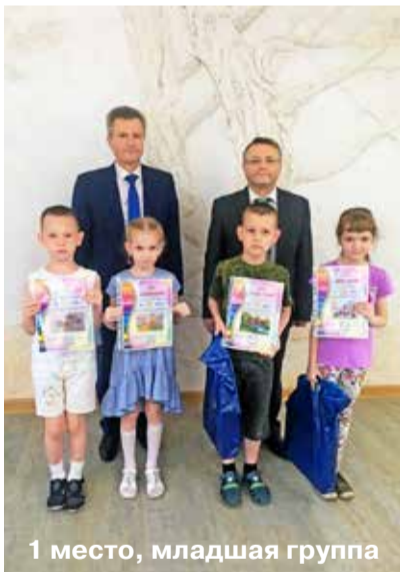
1 место, младшая группа

В преддверии Дня защиты детей первичная профсоюзная организация АВТОВАЗа АСМ РФ провела торжественное награждение всех победителей первого этапа конкурса детского рисунка «Транспортное средство будущего».