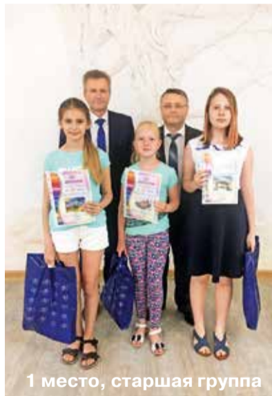
1 место, старшая группа

– Наверное, самая волнительная часть конкурса для ребят – это награждение. А для нас, взрослых, главное – это детские работы. Невозможно передать, сколько минут радости, восхищения, сколько эмоций подарили рисунки ваших детей. Именно благодаря юным художникам нам удалось посмотреть на мир глазами детей.