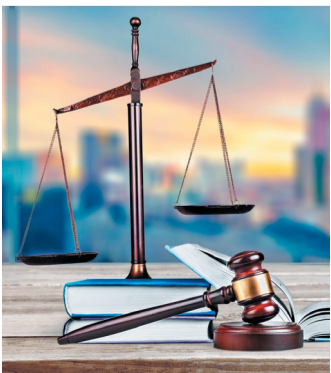
ГРАФИК ВЫЕЗДНЫХ КОНСУЛЬТАЦИЙ НА МАЙ 2025 ГОДА

Члены Профсоюза АСМ РФ вправе обращаться за юридической помощью в любой пункт выездных консультаций независимо от структурного подразделения Первичной профсоюзной организации АО «АВТОВАЗ» АСМ РФ, в котором они состоят на учёте.